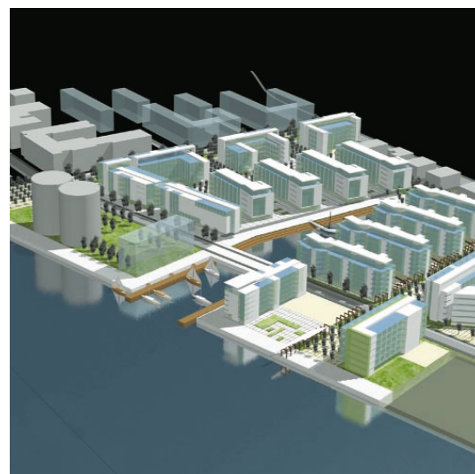
Øverst Modelfoto af TV-Byen.