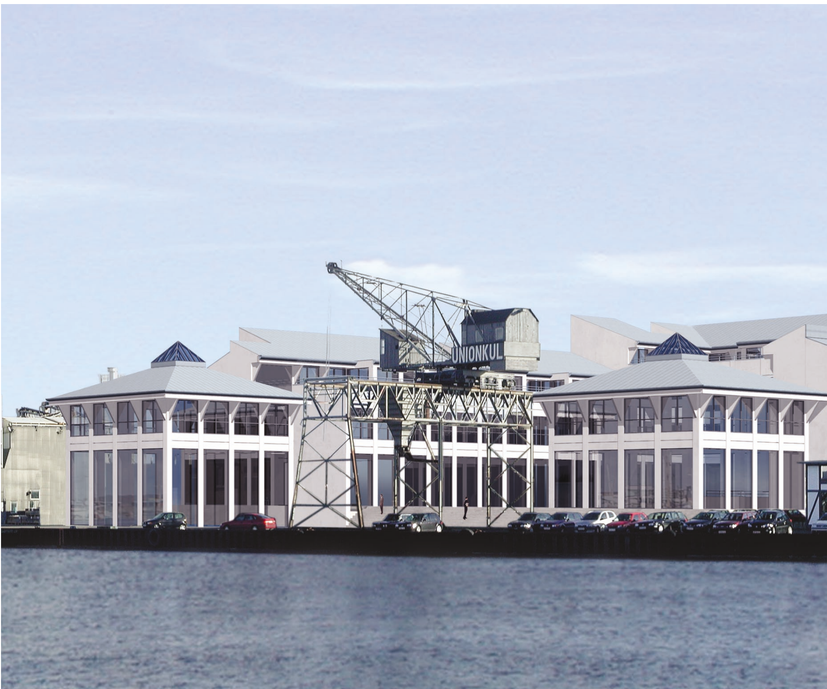
Union Kul - kommende projekt på 5.700 m 2 i Kalkbrænderihavnen.