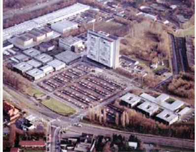
TV-Byen, Gladsaxe Visualisering af hvordan området kunne komme til at se ud.