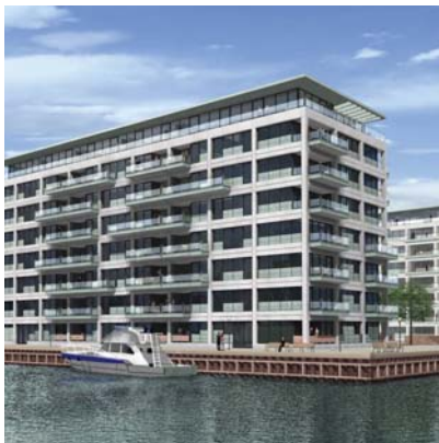
Kajplads 24, Havnestad Syd/Islands Brygge Visualisering af det nye boligprojekt.

Sjælsø Gruppen forhandler aktuelt om etablering af foreløbig 6.000 m 2 undervisning og administration i en del af byggeriet. Langsigtet er der planer om