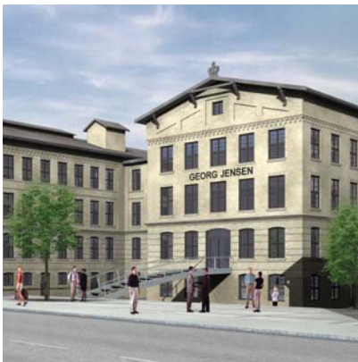
Georg Jensen, Porcelænshaven 11.500 m 2 nyt domicil.

Færdiggørelse og godkendelse af den nødvendige lokalplan for udvikling af området skrider frem som forventet. På den baggrund er det fortsat forventningen, at udlejning, om- og nybygning og videresalg i TV-Byen vil ske i flere etaper og strække sig over en periode på 2-10 år.