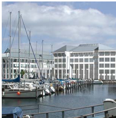
AHTS, Kalkbrænderihavnen Visualisering af udvidelsen.

Udvidelsen omfatter et samlet etageareal på 3.600 m 2 plus 1.600 m 2 kælder, herunder p-kælder, teknikrum m.v.