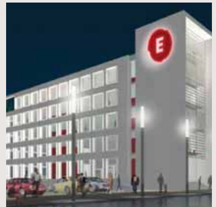
Københavns Energi's nye domicil, Ørestad

Sjælsø Gruppen indgik i maj måned aftale med Københavns Energi om opførelse af et nyt domicil i Ørestad. Byggeriet bliver på 14.000 m 2 kontor og