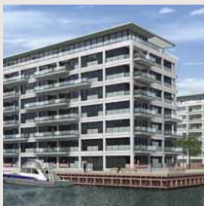
Kajplads 24 - boligprojekt, Havnestad Syd

Udviklingen af TV-Byen forløber planmæssigt. Den nødvendige lokalplan for at kunne gennemføre projektudviklingen forventes vedtaget ved årsskiftet. Derefter er det planen, i takt med efterspørgslen, at udvikle de store arealer i og