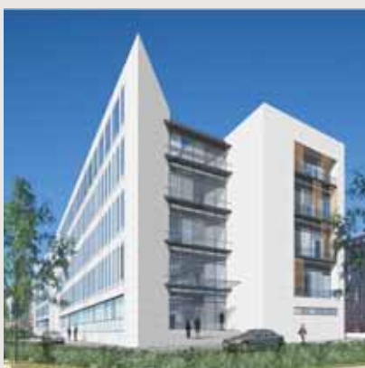
10.000 m 2 byggemulighed, Kalkbrænderihavnen

HTS - udvidelse af eksisterende domicil I foråret 2003 indgik Sjælsø Gruppen aftale med Handel, Transport og Serviceerhvervenes Arbejdsgiverforening om en udvidelse af HTS's domicil i Kalkbrænderihavnen. Udvidelsen, der bliver på 3.600 etagemeter plus 1.600 m 2 kælder, er klar til indflytning i sommeren 2004 og udgør en samlet projektværdi på ca. DKK 100 mio. Arkitektfirmaet Kim Utzon har tegnet såvel det nuværende domicil som den kommende udvidelse.