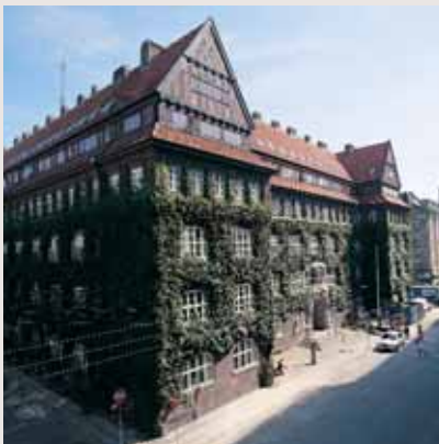
Københavns Energi's nuværende domicil, Vognmagergade, København

Projektet, der er tegnet af Arkitektfirmaet Kim Utzon, har været en stor succes og 75% af lejlighederne er allerede solgt. Byggeriet planlægges igangsat september 2003.