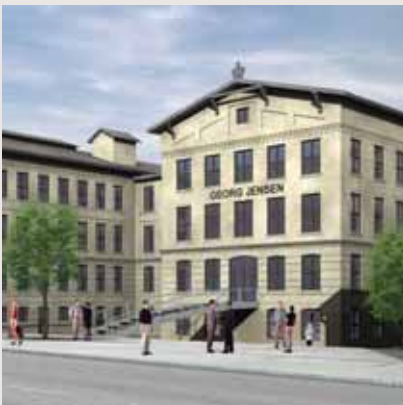
Georg Jensen, Frederiksberg

Dette projekt forventes solgt i indeværende år.